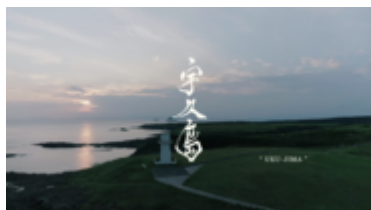
観光動画「宇久島」タイトル